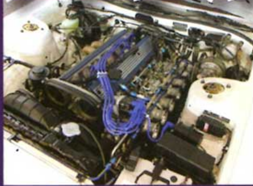
キレイなボディにゴールドの BBS と上品に仕上げられたこちらのソアラ。搭載されるエンジンは 3 リッターの 6M にソレックス 50φ という組み合わせ!