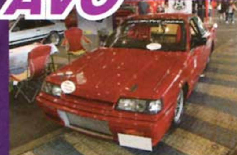
AVO のブースにはドラッグマシンとしては珍しい R31 の姿が