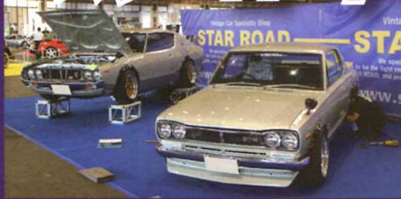
ブースには新車以上に仕上げられたハコスカとケンメリが、その2台にはスターロードが開発したホイール「GLOW STAR」が履かれていて絶妙なマッチング。他の旧車との相性も良さそうだ