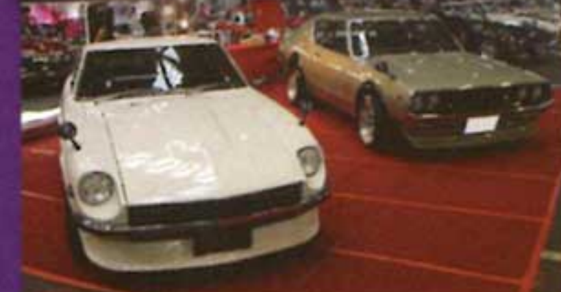
S30Z や箱スカ、ケンメリを中心とした旧車専門店のピットハウスブース!