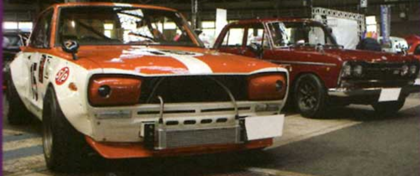
国産、外車問わず様々な旧車を扱うタキーズのブースには、ワークス仕様のハコスカやピカピカの S54 が展示されていた