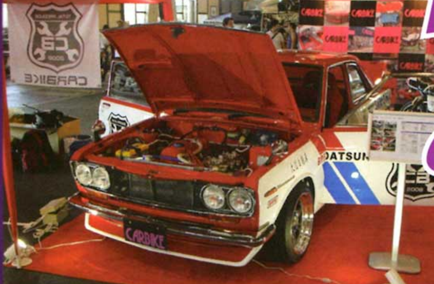
地元名古屋のショップ CAR BIKE には一際目立つ 510 プルの姿が。室内は内張りやシートを赤で統一し、メーターをすべて LED で鮮やかなものに交換する事で、近未来的な雰囲気が漂った個性が光るクルマへと仕上げられている