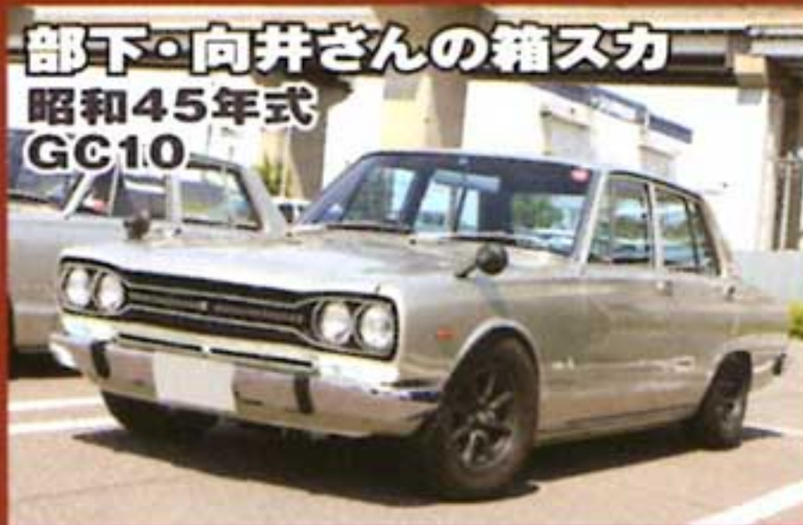
部下・向井さんの箱スカ 昭和45年式 GC10