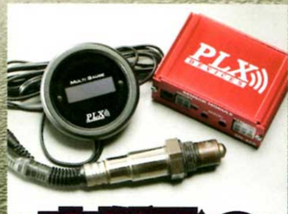
空燃比の 実際に迫る